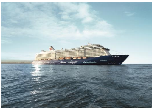
Mein Schiff 3 wird schwimmende Konzerthalle

Die Kreuzfahrt ist ab sofort im Reisebüro, unter www.tuicruises.com oder telefonisch unter +49 40 60001-5111 buchbar. Weitere Infos gibt es unter: www.tuicruises.com/furycruise