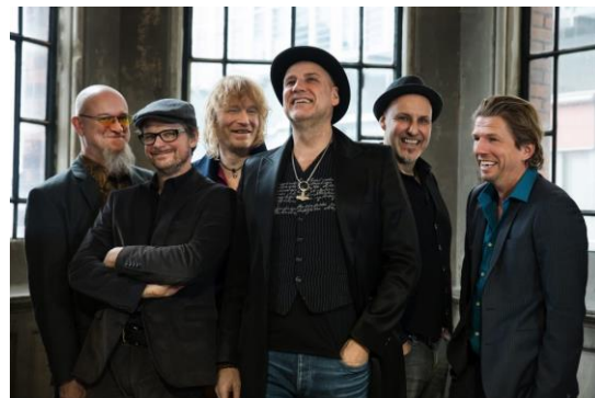
Top-Act Fury in the Slaughterhouse

TUI Cruises GmbH Communications Heidenkampsweg 58 20097 Hamburg